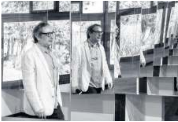
CORTESÍA/SURFOTO/ARTUR LESCHER ESTUDIO Y PIERO ATCHUGARRY GALLERY

Desde que desapareció el Wynwood Art District de Miami, en 2019, Little Haiti comenzó a concentrar galerías que escapaban de la gentrificación que sufrió Wynwood. Hoy Little Haiti es indiscutiblemente el nuevo epicentro del tejido galerístico de la ciudad. En este nuevo escenario, además de galerías emigradas del anterior distrito que tenían ya una importante trayectoria como, entre otras, Pan American Art Projects y Dot Fiftyone, surgen otras nuevas como es el caso de Piero Atchugarry.