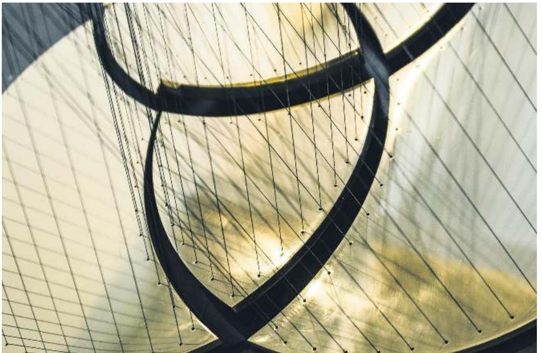
'INVERSO DO infinito', 2020.